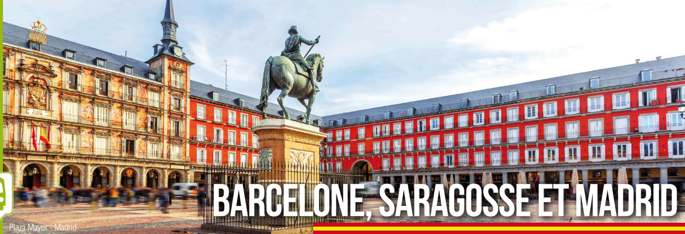
Plaza Mayor - Madrid